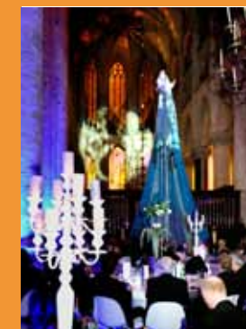
november Diner Concert

De Grote Kerk is eigendom van de Protestantse Gemeente Breda, die het gebouw en zijn inventaris om niet ter beschikking van de Stichting heeft gesteld op voorwaarde dat de Stichting zorg draagt voor de exploitatie, restauratie en onderhoud. De toren is eigendom van de Gemeente Breda. In gebruikersovereenkomsten zijn de belangrijkste rechten en plichten tussen de betrokken partijen geregeld.